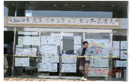
現地のボランティアセンター

災害ボランティアより受けた報告を取りまとめ、改善点や住民の要望などについて話し合い、翌日以降の活動に活かします。